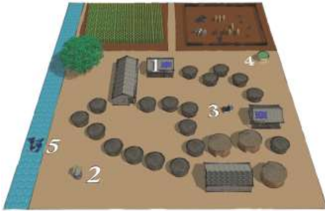
Abb.2: Konzeptvorstellung in Tinguri, Northern Region, Ghana

men mit einem Stromspeicher, der für eine möglichst ganztägige Stromversorgung sorgt. Dadurch sind die Bewohner in der Lage im Gebäude längere Zeit konzentriert zuarbeiten. Das Kochen am Abend in der Dunkelheit des Gebäudes wird ebenfalls erleichtert, sowie das Lesen von Büchern. Auch das Aufladen von Mobiltelefon-Akkus im eigenen Gebäude wird ermöglicht.