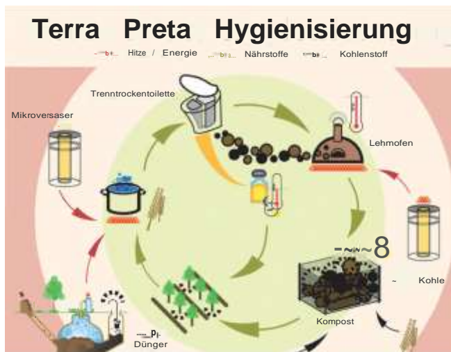
Abb. 1: Das Prinzip der Terra Preta Hygienisierung